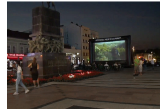
Nišville Jazz Theater Festival, Niš, Serbie 9 août 2022