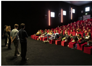
37. Festival International du Film de Fribourg, 21+25 mars 2023