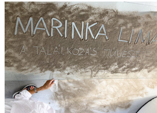
Trafik Kőr, Dabas, Hongrie 11-21 août 2022