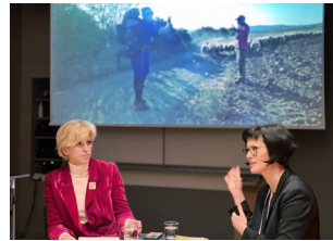
Université de musique et des arts du spectacle, Vienne, 13 janvier 2023