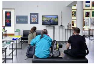
Hefter Galerie, Pannonhalma, Hongrie, 1-31 mars 2023