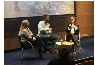
Musée Ludwig, Budapest, Hongrie 7 décembre 2022