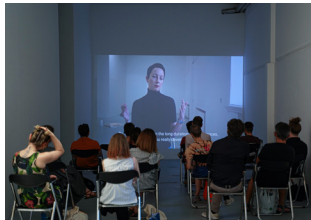
U10 galerie, Belgrade, Serbie 17 août 2022