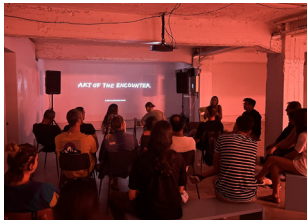
Wisedog, Larissa, Grèce 5+12 septembre 2022