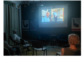
Savremena galerija, Subotica, Serbie, 19 juillet 2023