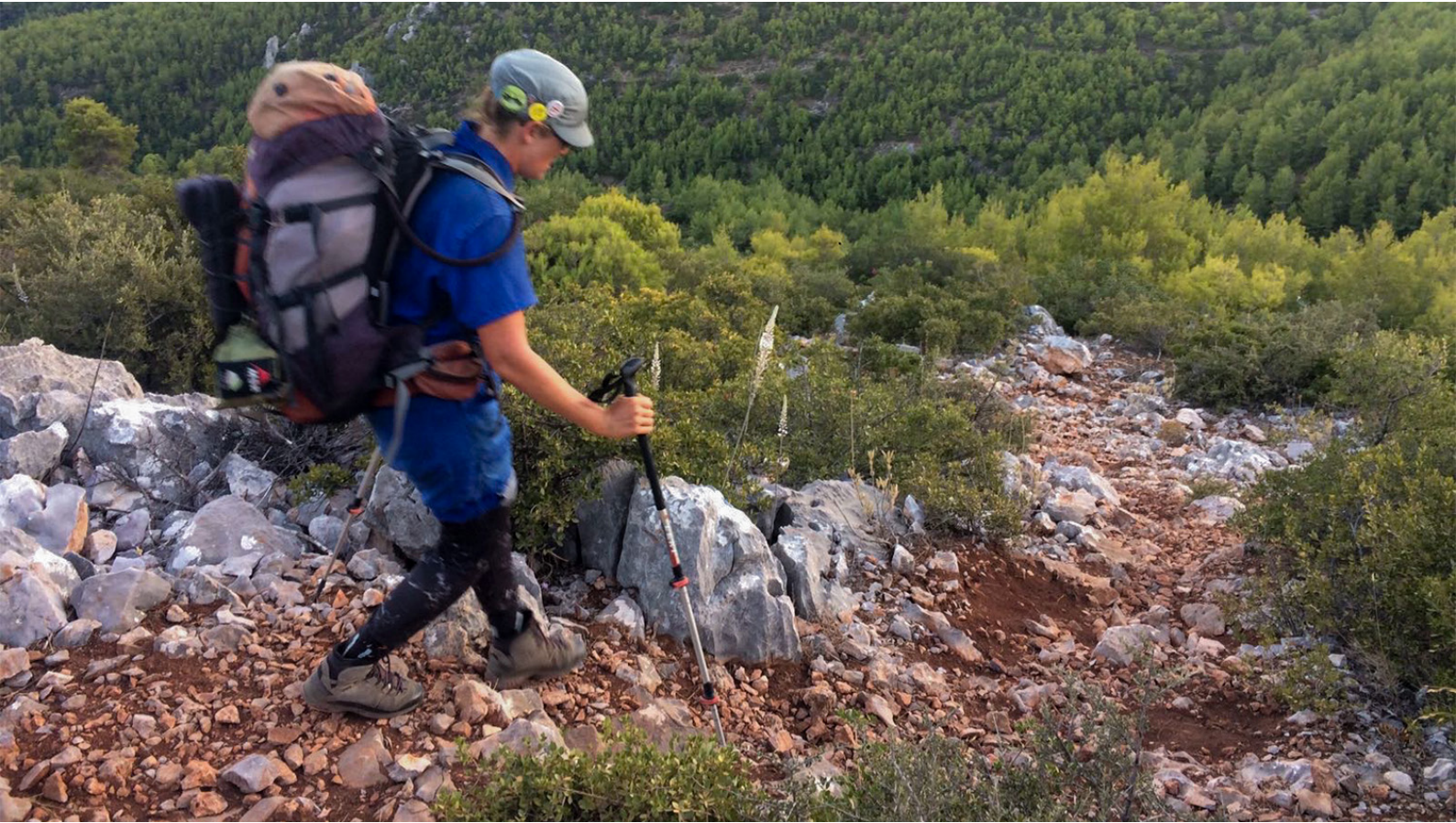
Fyli, Greece, september 16, 2017